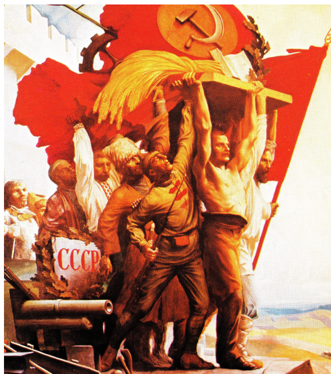
G.M. Kartov, 'Folkeslagenes venskab', 1924-32. Sovjetisk statskunst.