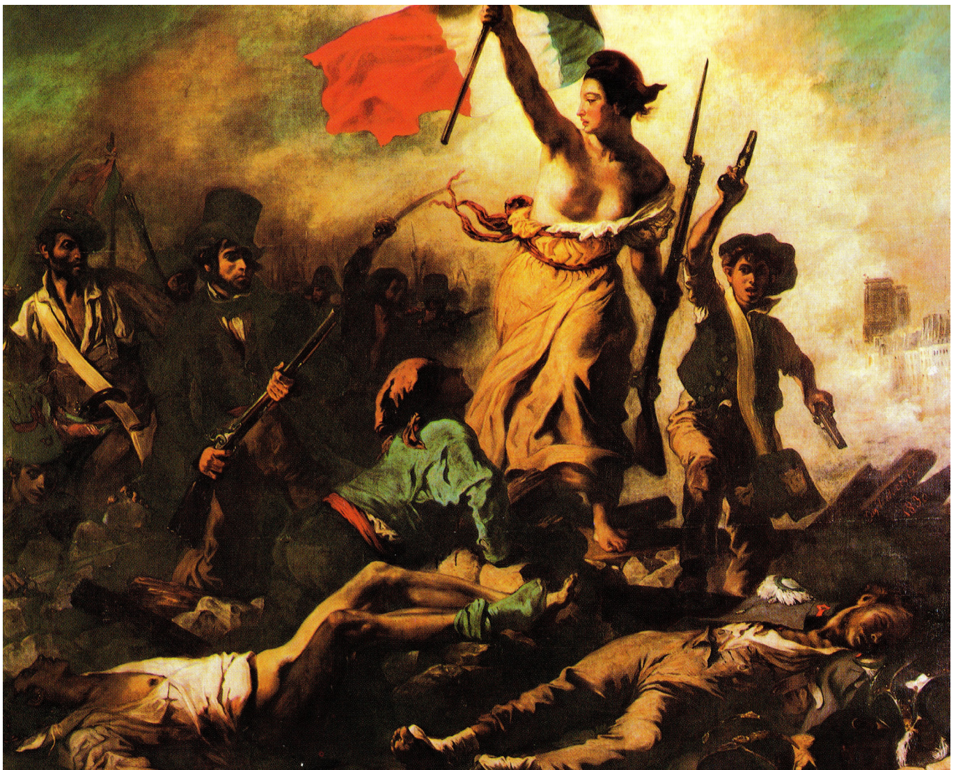
Eugene Delacroix, 'Friheden fører folket på barrikaderne', 1830. Ansporet af julirevolutionen. Romantik.

Industrialiseringen betød også, at der opstod andre nye og helt anderledes fokuspunkter for de kunstneriske strømninger. ”Arts and Crafts Movement”, en æstetisk reformbevægelse i England i anden halvdel af 1800-tallet, reagerede imod en hovedløs ”industrialiseret æstetik” og formede en bevidst æstetisk kvalitet og design. Det var startskuddet til den europæiske design