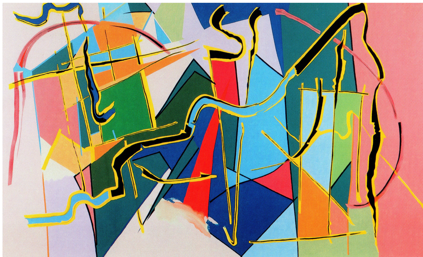
Richard Mortensen, 'En genfødsel i nærheden af Cambodia', 1975.

Hjulet i den kunsthistoriske udvikling er måske netop nu ved at dreje endnu en omgang. Vi er hastigt på vej ind i en ny alvorlig og farlig politisk periode, som er defineret ved gigantiske politiske konflikter og udfordringer: En altødelæggende klimakrise – krige i Ukraine og Mellemøsten der risikerer at komme ud af kontrol – demokratierne og de demokratiske rettigheder og ytringsfriheden er truet, en højreradikal populisme og autokratier vinder frem internationalt, og der er klare, sammenlignelige træk til tiden i 1930-erne. Donald Trump i USA er et glimrende eksempel på, hvor farlig situationen er – en voldsom international flygtningekrise på grund af klimaforandringer, sult og ulighed – der er flygtningekrisen med flygtningestrømme fra de fattige lande mod de rige lande.