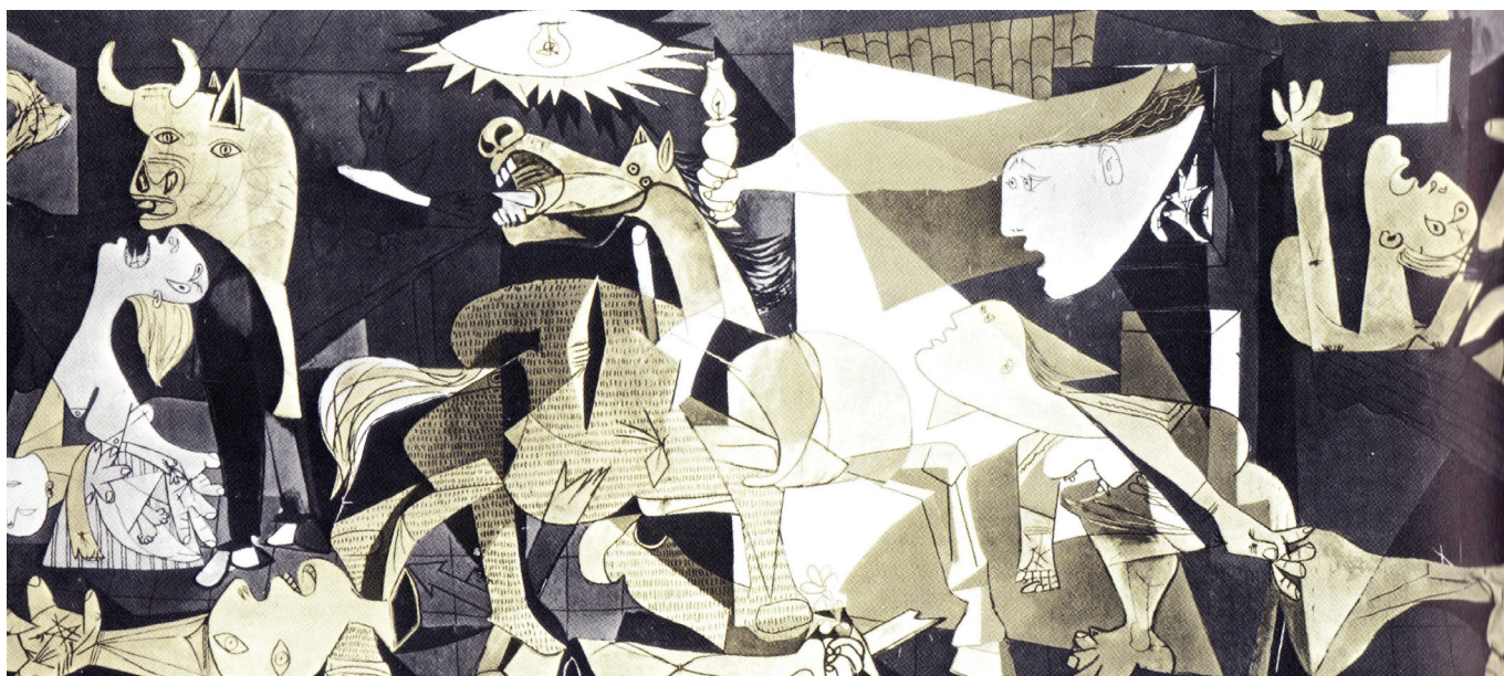
Pablo Picasso, 'Guernica', 1937. En dybfølt protest mod general Franco's og nazisternes bombardement af civilbefolkningen i den Baskiske by Guernica.

Den store Cobraudstilling i Amsterdam 3.–28. november 1949 på Stedelijk Museet endte helt galt. "Kommunistiske slagsmål i Museet", "Stedelijk Museum offer for kommunistisk propaganda" hed det i medierne. Christian Dotremont (belgisk maler og digter)